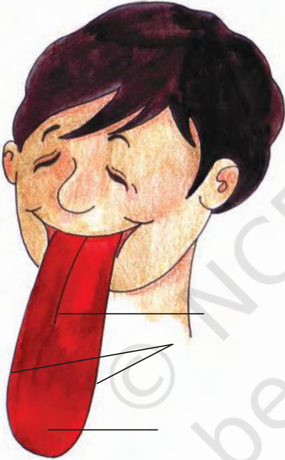
जीभ के हिस्सों को चित्र में दर्शाए