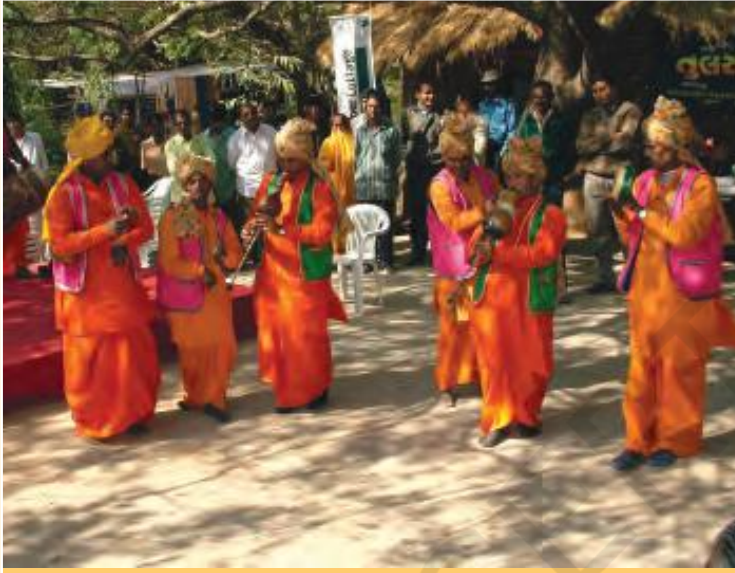
बीन पार्टी के बाजे

को बुरी हालत में रखते हैं। चाहते तो हम भी साँपों को मारकर खूब पैसा कमा सकते थे। तब हमारी ज़िंदगी इतनी मुश्किल भरी न होती। साँपों को मारने की बात तो दूर, ये तो हमारी पूँजी हैं जो हम अपनी आने वाली पीढ़ी को सौंपते हैं। साँपों को तो हम अपनी बेटियों को शादी में तोहफ़े के रूप में भी देते हैं। हमारे कालबेलिया नाच में भी साँप जैसी मुद्राएँ होती हैं।